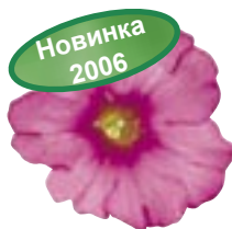
Rose w/Eye Imp.