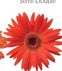
Apricot with Eye