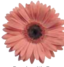
Peach with Eye