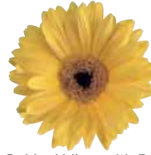
Golden Yellow with Eye