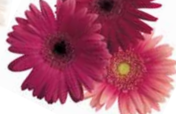
Rose Shades Semi-Double