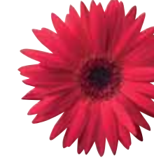
Red with Eye