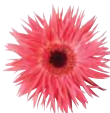
Spider Salmon with Eye