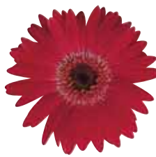
Cherry with Eye