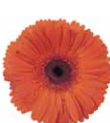
Orange with Eye