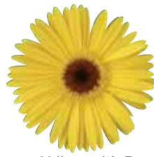
Yellow with Eye