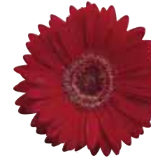
Scarlet with Eye