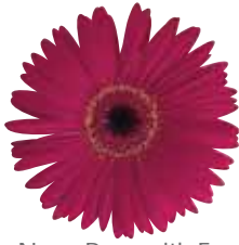
Neon Rose with Eye