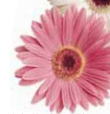
Pink Shades with Eye