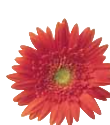
Orange Shades Semi-Double