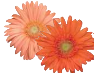
Salmon Orange Shades