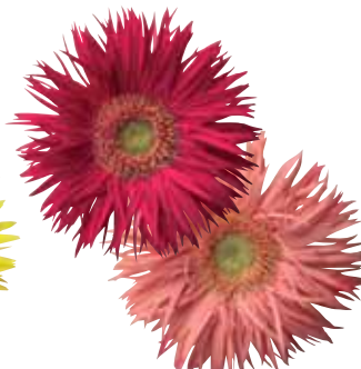
Spider Salmon Red Shades Imp.